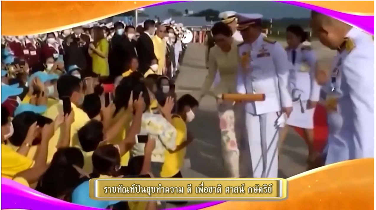
ราชทัณฑ์ป็นสุขทำความ ดี เพื่อชาติ ศาสน์ กษัตริย์