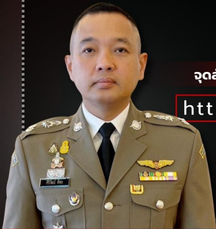
พล.ต.ต.ศิริวัฒน์ ตีพอ รองโฆษกสำนักงานตำรวจแห่งชาติ

ส่วน Path ทำหลอก มี .go.th ให้ดูเหมือนเว็บไซต์ราชการ สังเกตว่ามีเครื่องหมาย / ด้านหน้า