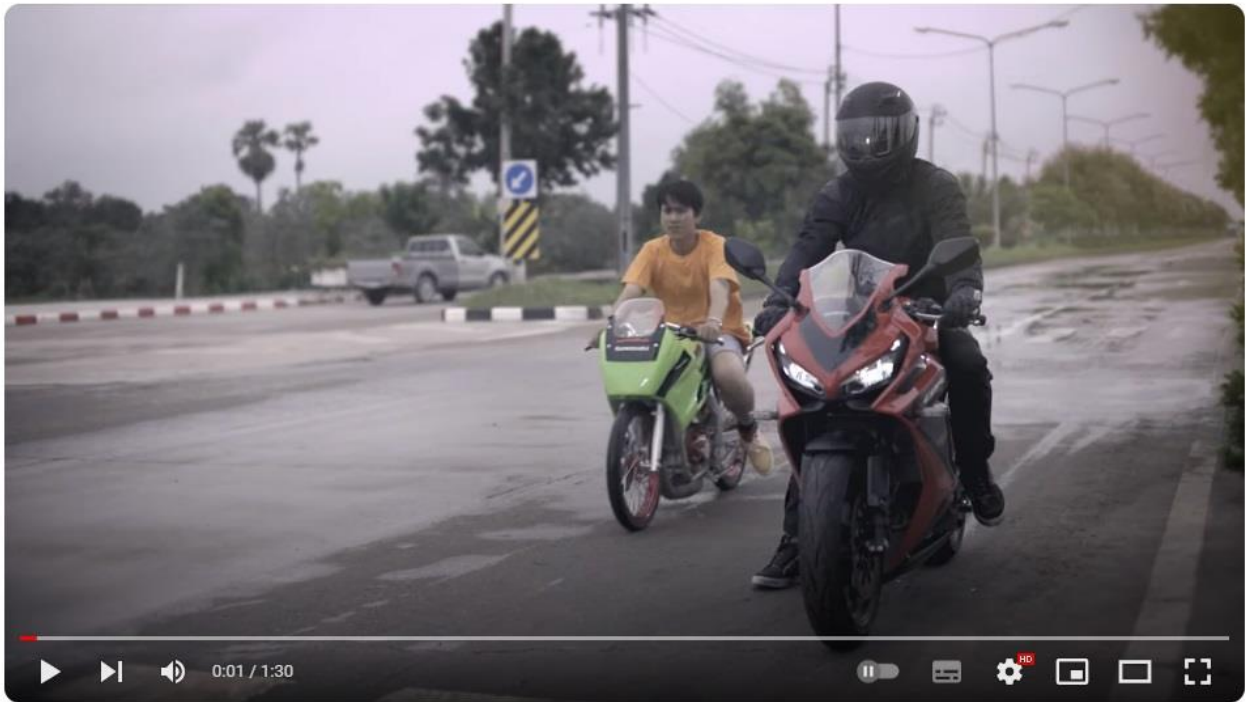
ความเร็วใช้ให้ถูกที่

https://www.youtube.com/watch?v=y6gucVvKSLk