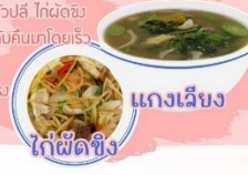
ไข่ผัดขิง

เมนูอาหารที่แนะนำ ได้แก่ แกงเลียง ยำหัวปลี ไข่ผัดขิง ช่วยบำรุงร่างกาย เสริมพลังให้มดลูกกลับคืนปกติโดยเร็ว และช่วยฟื้นฟูสุขภาพร่างกายให้แข็งแรง จะได้มีน้ำนม เลี้ยงดูบุตรด้วยความแข็งแรง