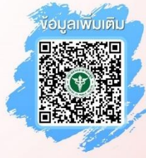
ข้อมูลเพิ่มเติม