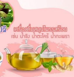
เครื่องดื่มสมุนไพรธรรมชาติ เช่น น้ำขิง น้ำตะไคร้ น้ำกะเพรา